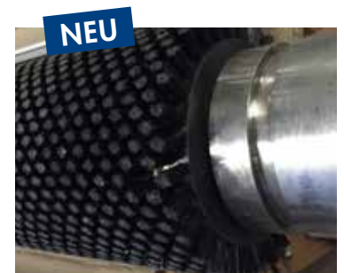
Walze mit Kunststoffbürste

Für weitere Informationen kontaktieren Sie bitte: