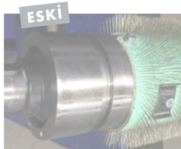
Tel sarımlı silindir