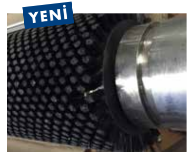
Sentetik fırçalı silindir